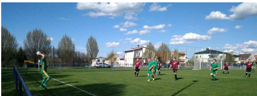
Obr. Utkání v Bohuslavicích ►

Dolní Benešov opět potvrdil, že hraje jak na houpačce. Tentokrát byl nahoře a zvítězil. Prvních třicet pět minut byly jasně v režii Benešova, a právě ty rozhodly o jeho výhře. Hned po pár sekundách se domácí družina ujala vedení, když Mlýnek vyslal do uličky Ševčíka, který našel nahrávkou pod sebou Stříbného, který dorážel do prázdné branky - 1:0. Po čtvrt hodině hry našel Stříbný Mlýnka, jehož střela orazítkovala břevno, a všude byl Polák hlavou zametl míč do sítě - 2:0. Pak šel dvakrát sám na gólmána Stříbný, ale neuspěl. Ve 33. minutě našel Husovský dlouhým balonem za obranou Mlýnka, který nasadil kličku gólmanovi a zasouval do prázdné klece - 3:0. Teprve teď se začaly osmělovat i Sudice. Střely Riemela, Havrankeho a Vojtěch Kryštofa si ale svůj cíl nenašly. Úvod druhé půle patřil Sudicím, když se ve 47. minutě odrazil balon na malém vápně k Tomáši Kryštofovi, který už neměl problém ho zasunout za záda brankáře - 3:1 . Sudice pak byly opticky lepším týmem, ale jejich snaha většinou končila před šestnáctkou. Dostaly se k pár střelám Havrankeho, Valníčka a Tomáše Kryštofa. Benešov naopak hrozil neustále z rychlých brejků. Husovský sám trefil jen brankáře, Ševčík dvakrát ztroskotal na gólmanovi a Kichner zase netrefil brankovou konstrukci. Skóre se už nezměnilo a Benešov si tři body uhájil.