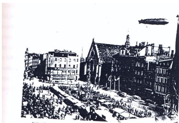
Ratibor: Markt auf dem Ring (Aufnahme von 1927, Ost- und Nordseite des Blicks in die Oderská ulice)