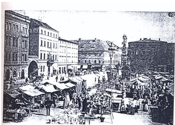
Ratibor: Jarmark na náměstí (západní a severní strana)