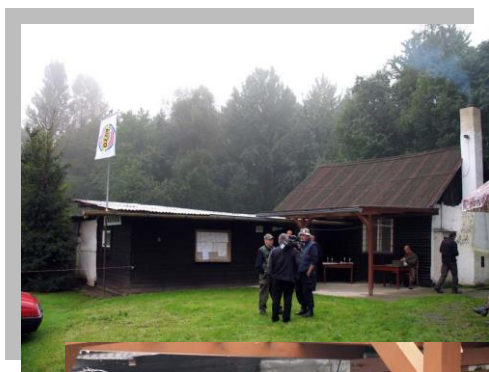
Pár fotografií z akce