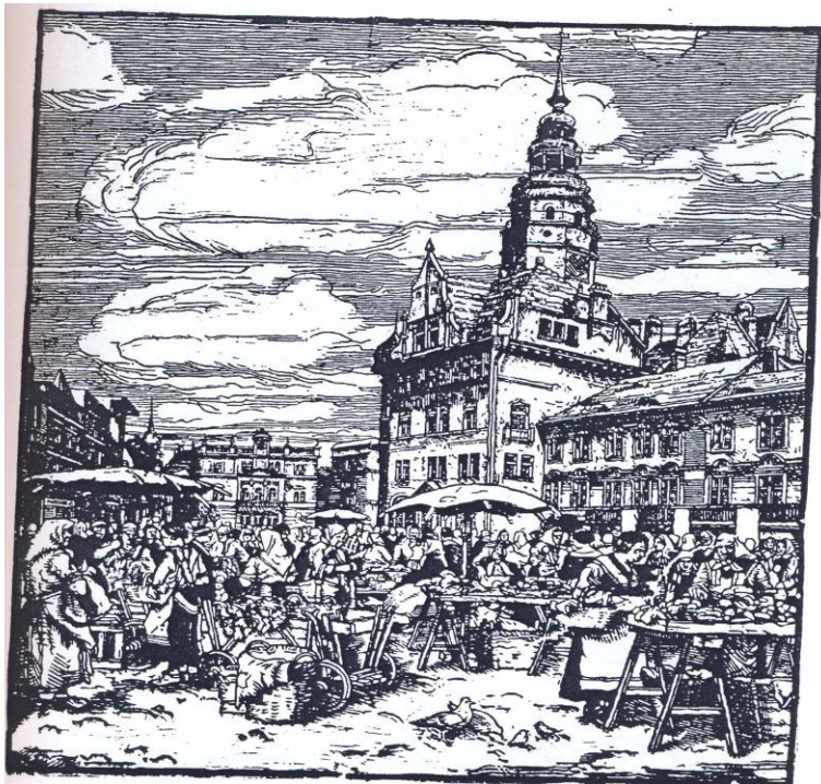
OPAVA Trh na Horním náměstí (Dřevořezba od Erwina Zieglera, 1934)