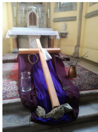
Obr. V sudickém kostele